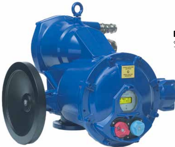
BERNARD CONTROLS SQX INTELLI+® version