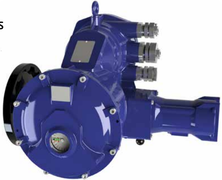
BERNARD CONTROLS SQX SWITCH version

Explosionproof Quarter-turn Actuators Servomoteurs Quart de tour Anti-déflagrants