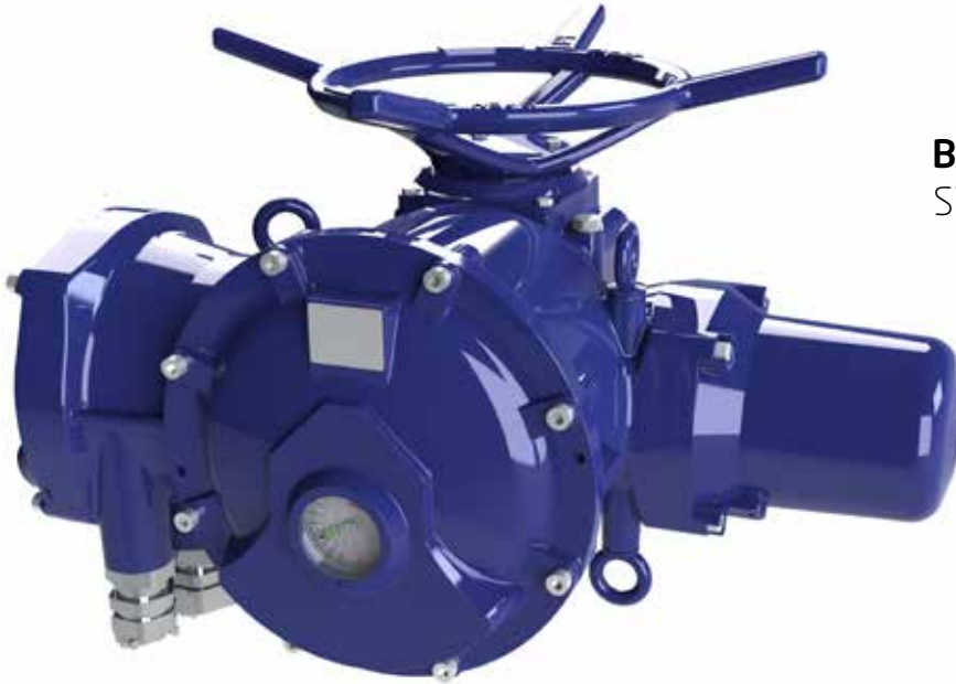
BERNARD CONTROLS STX INTELLI+® version

Explosionproof Multi-turn Actuators Servomoteurs Multi-tours Anti-déflagrants