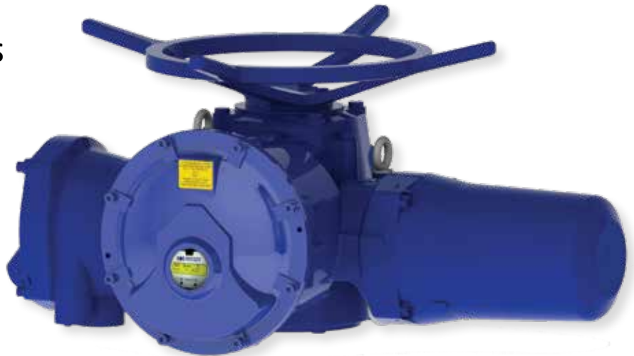
BERNARD CONTROLS STX SWITCH version